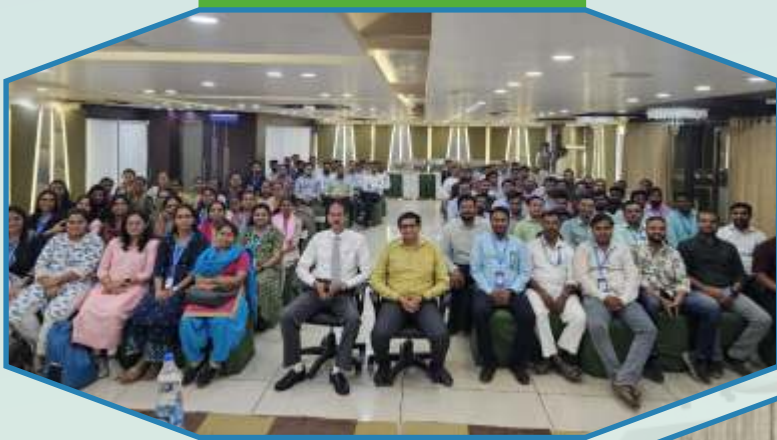
Meeting with office assistants in Himatnagar Region