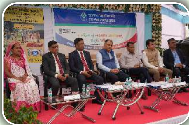
Financial Inclusion Santrupti Abhiyan - Regional Director RBI visited Vadodara