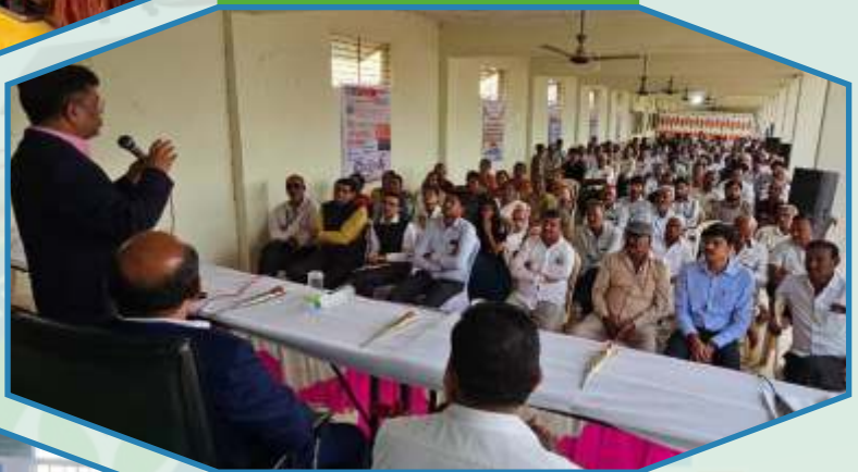
Chairman addressing a Gram Sabha at Haripar Branch Taluka Lalpur of Jamnagar Region