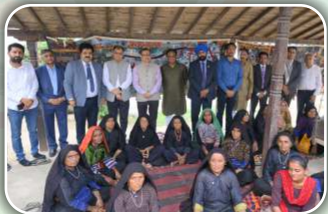
Jan Suraksha Santrupti Abhiyan held at Bhuj