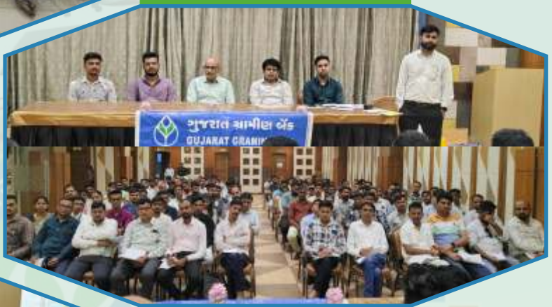
Performance Review meeting of branches in Bhuj Region