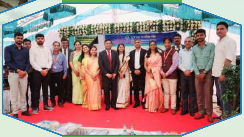
Depositor Education and Awareness Fund (DEAF) inauguration camp at Vasai village by Dabhoi Branch of Vadodara Region