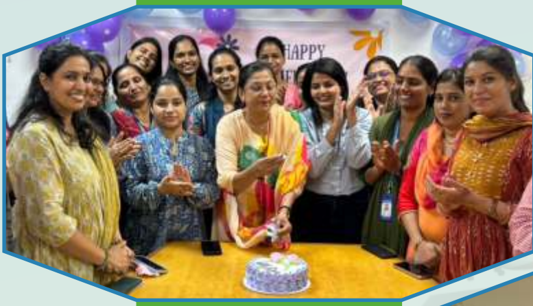
Women's Day celebration in Valsad Region