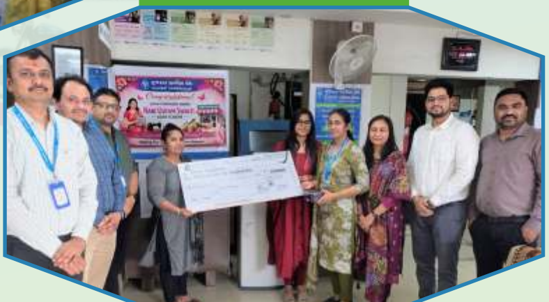
Mega Credit Drive for Female on International Women's day in Surendranagar Region