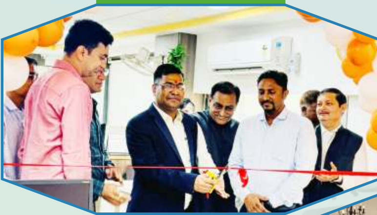
Inauguration of Retail Loan Factory (RLF) in Rajkot Regional Office