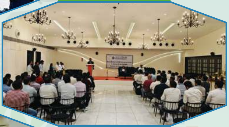
Review Meeting and Felicitation of Branches in Mehsana Region