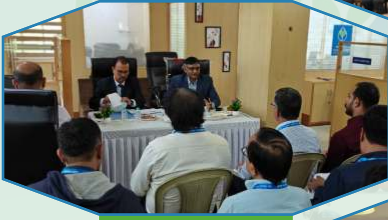
Depositor Education and Awareness Fund (DEAF) Program at Radhanpur of Patan Region