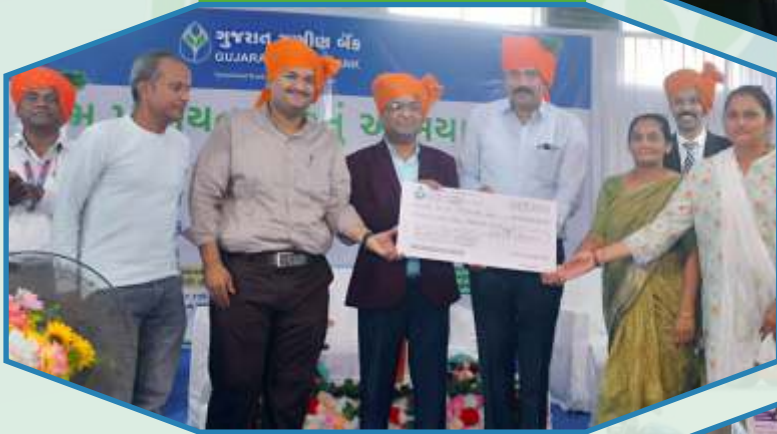
Gramsabha at Samadhiyala Branch of Junagadh Region