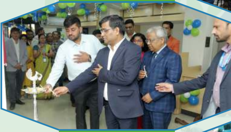
Shifting of Branch Premises - Sachin Branch of Surat Region